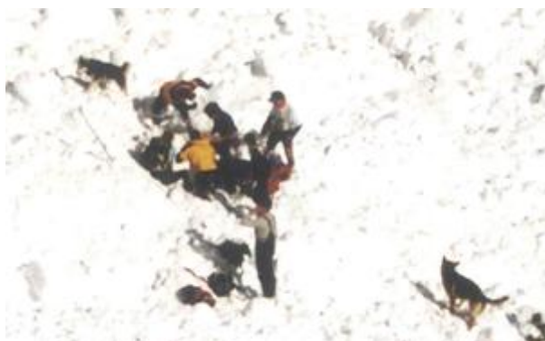
Rescat de la víctima