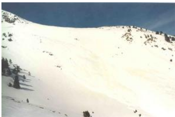
Moment en què es desencadena l'allau