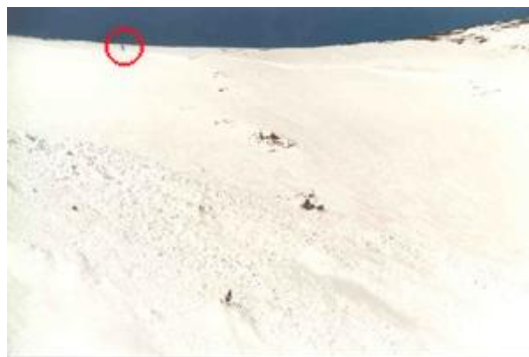
Detall del moment en què cau l'allau, observi's la tercera persona just damunt de la cicatriu