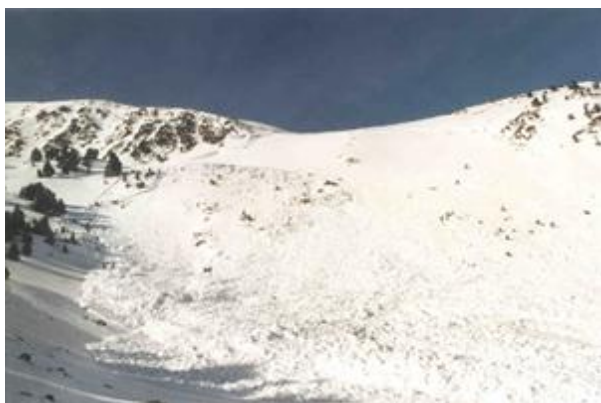
L'allau acabat de caure